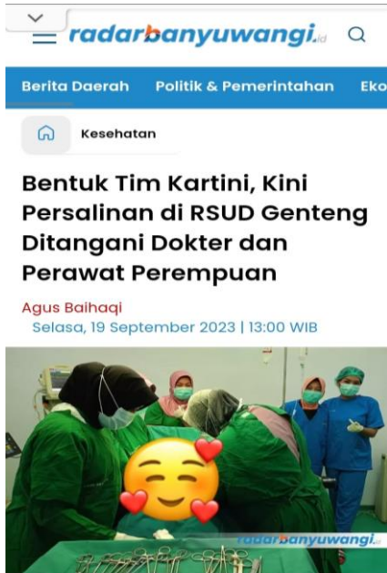
CANTIK: Tim Kartini saat memberi pelayanan pada pasien yang melahirkan di RSUD Genteng.