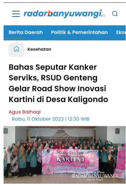
KUNJUNGAN: Tim kreatif RSUD Genteng melakukan road show inovasi Kartini di Desa Kaligondo, Kecamatan Genteng, Banyuwangi.