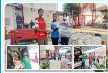
Bantuan 3 ton beras kepada korban banjir di wilayah Pati