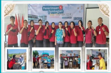
Program Bank Makanan