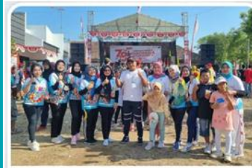
Jalan Santai Desa Sukoharjo