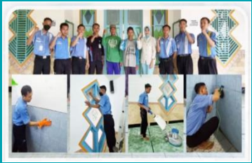
Program Pembersihan Masjid