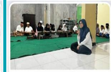
Nuzulul Qur'an KSH Bersama Warga PSi Desa Sukoharjo