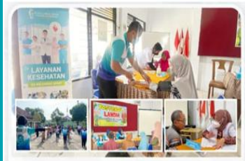
Posyandu Lansia Rutin Desa Sukoharjo