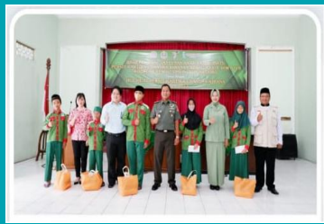
Program pemberian santunan yatim piatu