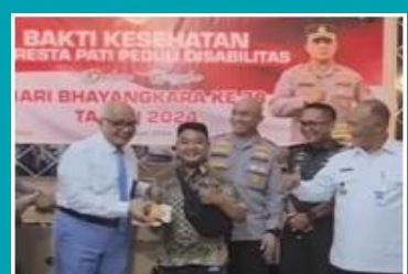
Program Alat Bantu Disabilitas