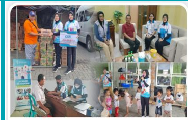
Pengobatan gratis dan trauma healing korban bencana