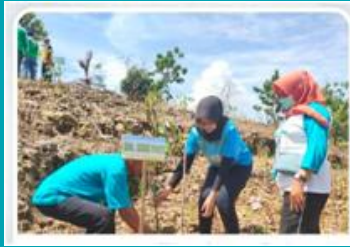
Penanaman 100 bibit pohon di kawasan Pegunungan Kendeng