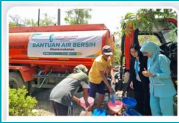
Bantuan air bersih sebanyak 36 tangki kepada Warga terdampak kekeringan