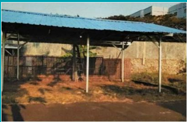
Pembuatan Atap Lapangan Tenis Meja