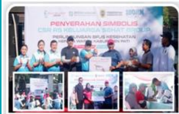
Penyerahan secara simbolis perlindungan BPJS Kesehatan kepada warga kurang mampu di Kab Pati