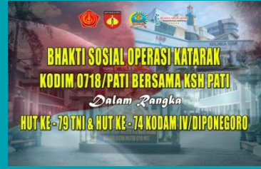
Operasi Katarak Gratis