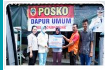
Bantuan logistik kepada Warga terdampak banjir di wilayah Pati & sekitarnya