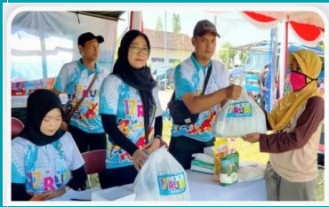
Program Bazar Murah