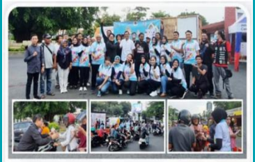
Program pembagian takjil