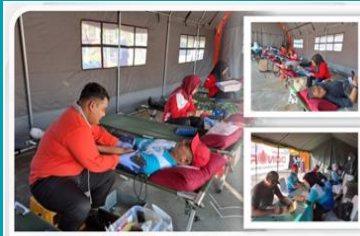
Kegiatan donor darah