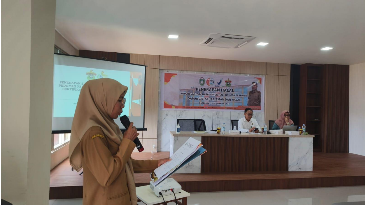
FOTO SOSIALISASI PENERAPAN HALAL RS.dr.HASRI AINUN HABIBIE