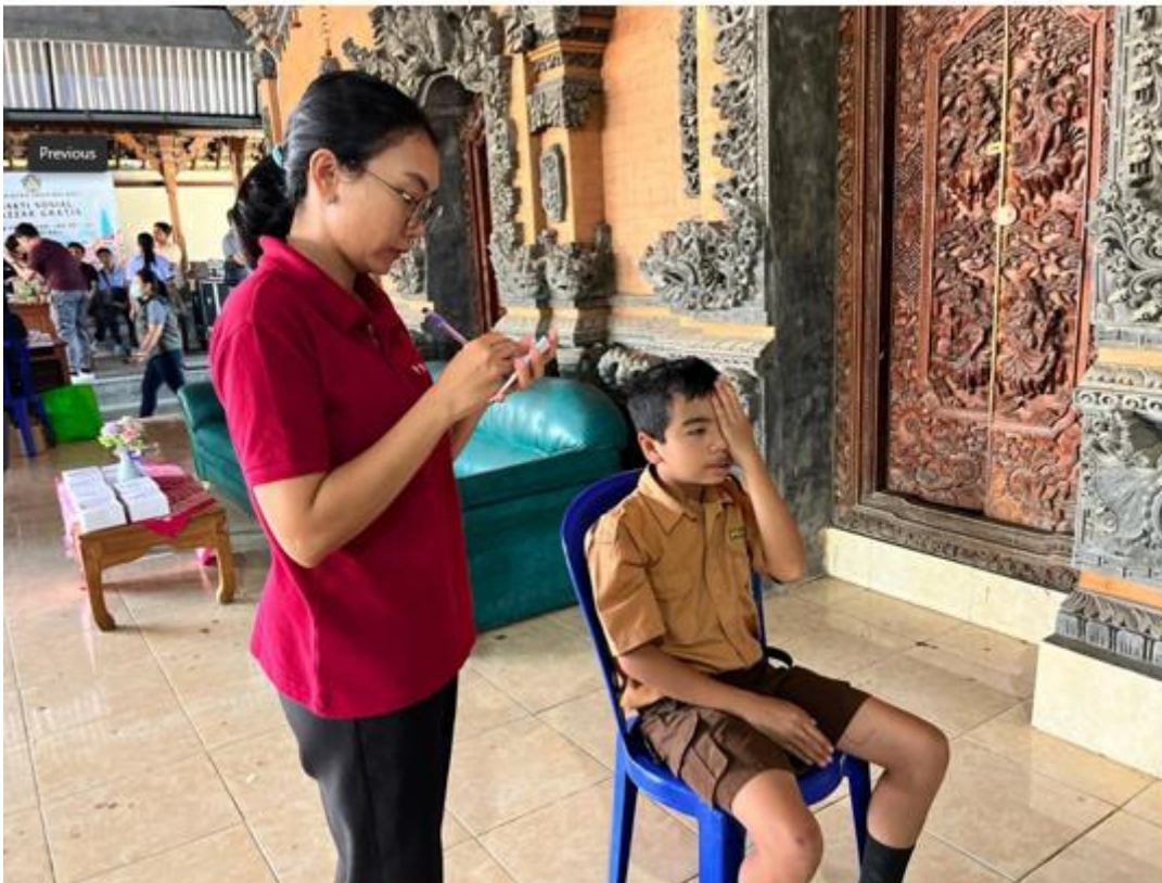
SKRINING ANAK SD DESA SEKARDADI 3 AGUSTUS 2024