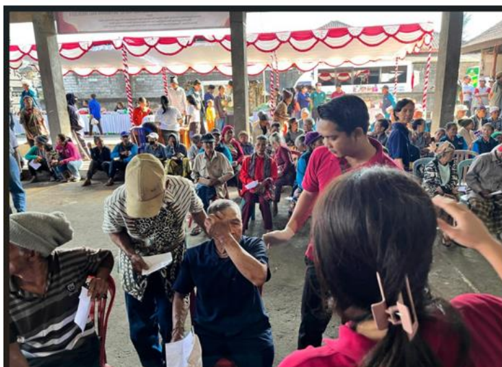
PEMERIKSAAN MATA DAN PEMBAGIAN KACA MATA BACA DESA SEKARDAD