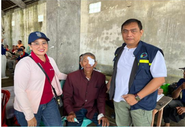
OPERASI KATARAK DESA SEKARDADI 3 AGUSTUS 2024