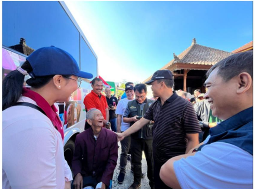
OPERASI KATARAK DI DESA SEKARDADI 3 AGUSTUS 2024