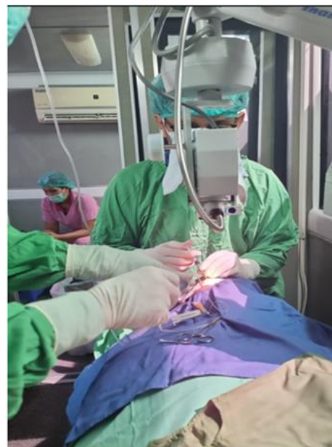
Operasi Katarak Desa Sekardadi 3 Agustus 2024