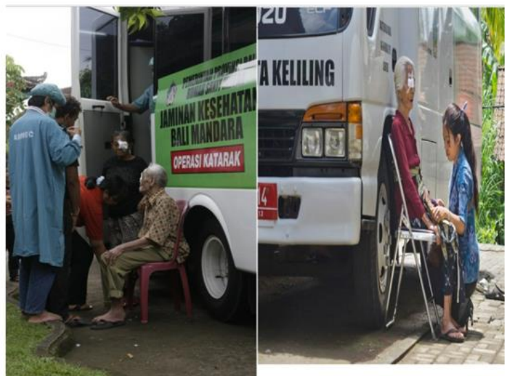
BUS OPERASI KATARAK KELILING RS MATA BALI MANDARA