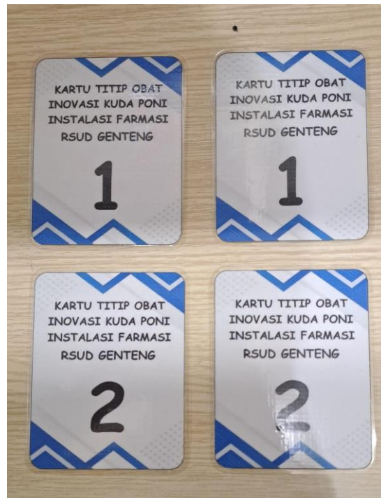
KARTU LAYANAN KUDA PONI