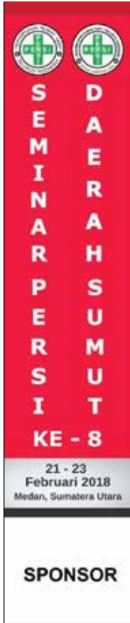
Umbul-Umbul Versi 1 (Logo Sponsor: 1m x 1m)